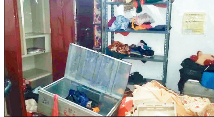
घर में बिखरा सामान।

किराए के मकानों में चोरी की सूचना मिली है। मामले में पुलिस ने अपराध दर्ज किया है और जांच चल रही है। एक संदेही की पहचान हुई है जल्द ही आरोपियों को गिरफ्तार कर लिया जाएगा -अमोलक सिंह दिल्ली, एएसपी