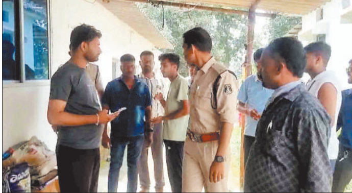
जानकारी लेते पुलिस अधिकारी।