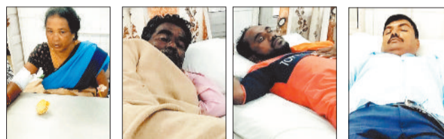
घायलों का अस्पताल में चल रहा इलाज।